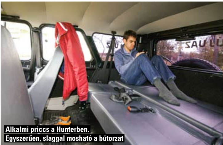
Alkalmi pricc a Hunterben. Egyszerűen, slaggal mosható a bútorzat

gyeibe a Pickup. A Limited csúcscs felszereltséghez számtalan kényelmi extra jár, de nélkülük is komfortos az autó, könnyen kezelhető és a kategóriában megszokott elpusztíthatatlanság érzését nyújtja. Legfeltűnőbb extrája a 7 colos központi kijelző, amely a navigáción kívül a tolatókamerának is felületet ad, és olyan kütyüket is tartalmaz, mint a digitális iránytű. A terepjáróként (Patriot) és járóképes alvázként (Cargo) is készülő modell teljes értékű munkaeszköz, amit kirándulásokra is be lehet vetni, Somogybabad terep pályáit már sikeresen megjárta a kipróbált példány.