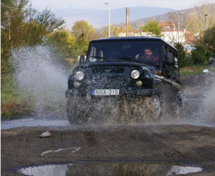
Öblös szívómotor az elnyúlhatatlanság ígéretével

szokatlanul puhák, a legtöbb riválisnál komfortosabb a második sorban ülni. A formák az elmúlt éveket idézik, egy kicsit komor a hangulat, az anyagminőség viszont egy személyautóban is megállná a helyét; a Lada jelenlegi modelljeiben sem találunk ennyi puha műanyagot. Pedig a beszállítók közösek, például ugyanazt az indítókulcsot fordítom el, mint a Kalinában vagy a Grantában. Nem csak nagy hasmagasság, kapcsolható összkerekhajtás és felező is jár alapáron, amire a fotózáson nem is volt szükség, olyan lendülettel vetette bele magát a gyöngyösi szőlőhegy görön-