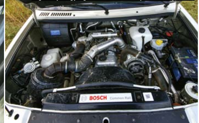
A gázolajos egység vezérlőelektronikája Bosch-fejlesztés

zeket és egy kis türelmet kíván a ledöntés művelete, de egy ilyen nyers, volt szovjet tárgytól nem is számítottunk másra. A kormány óriási holtjátéka is csak mai szemmel feltűnő, akárcsak a Lada 4x4-est, ezt a túlélőt is igazi szórakozás vezetni, hiszen nem más, mint egy vadonatúj veterán. Nem csodálom, hogy a badacsonyi UAZ-okat is újakra cserélték, ilyen felszabadultan csak kevés terepjárával lehet pocsolóyából pocsolóyába ugratni, és nincs még egy, amelyiknek a hátsó ablakán nézhetné ki balra fordulás előtt.