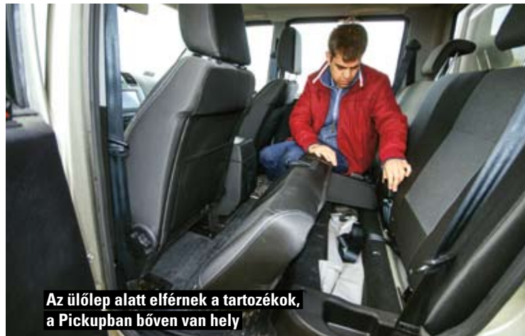
Az ülőlép alatt elférnek a tartozékok, a Pickupban bőven van hely