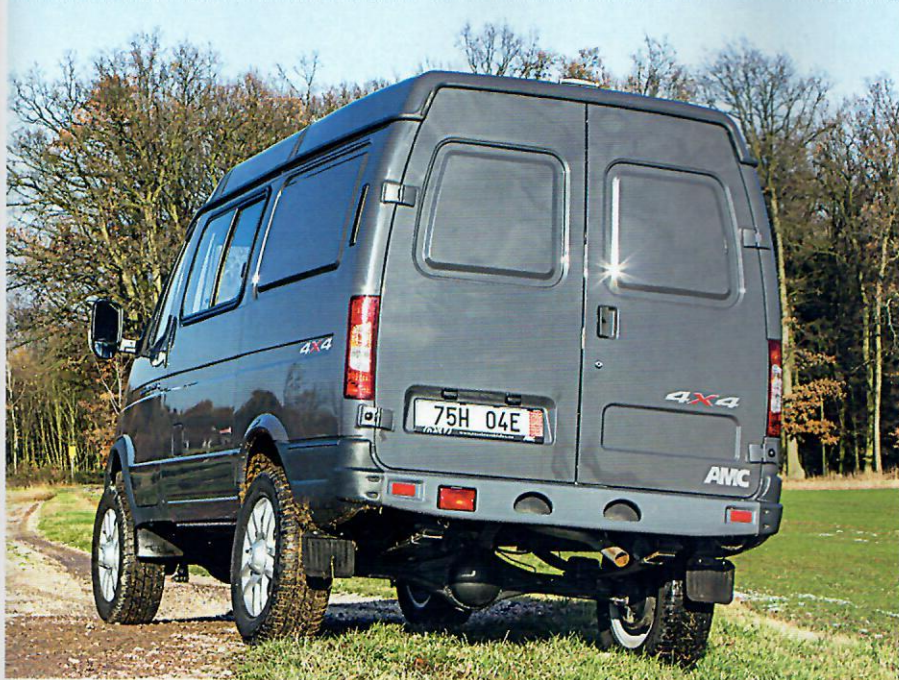
Bezúdržbové kardanové tyče byly vyrobeny v USA společností Spicer-Dana.