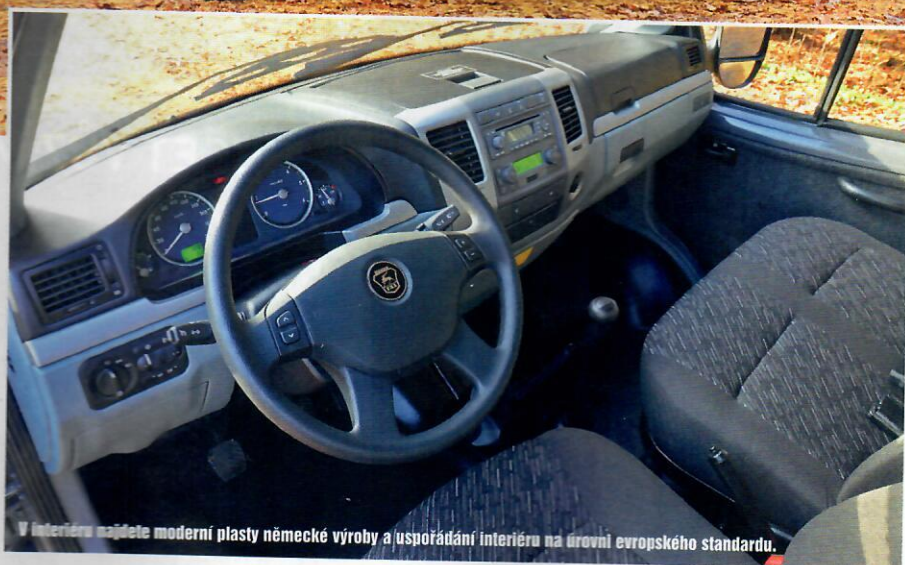
V interiéru najdete moderní plasty německé výroby a uspořádání interiéru na úrovni evropského standardu.

Když se zadíváte na trh s východními vozy, nemůžete minout užitkové automobily ruského výrobce GAZ, který potřebu cenově dostupné a odolné terénní dodávky dokáže pohodlně uspokojit celou modelovou řadou automobilů Sobol a Gazelle.